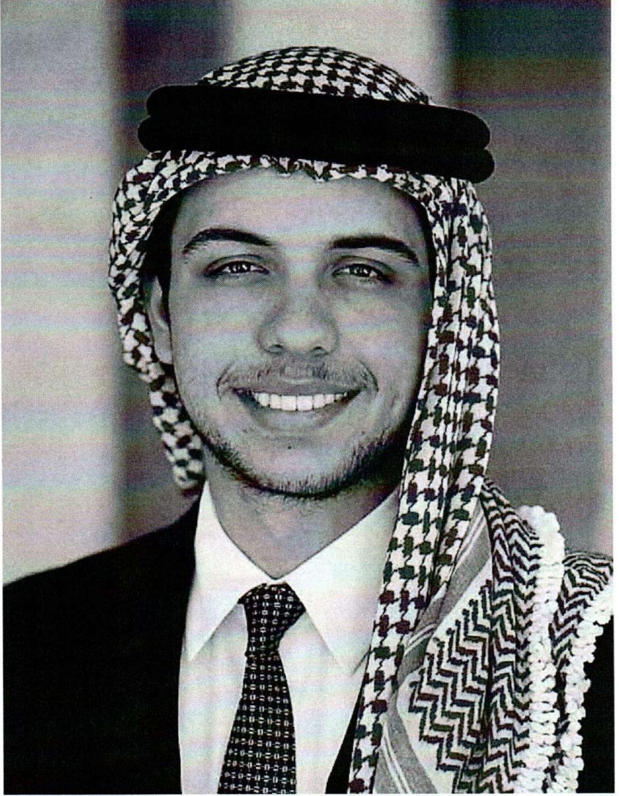
حضرة صاحب السمو الملكي الأمير الحسين بن عبدالله الثاني ولي العهد المعظم